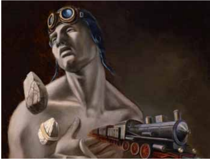
Ciriaco De Mita