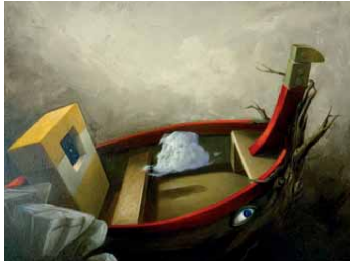
Ciriaco De Mita